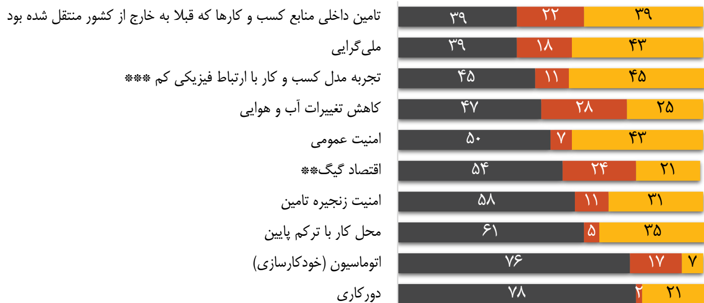
درصدی از پاسخ‌دهندگان

در روزهای نخست پاندمی، بسیاری از رهبران به سرعت متوجه شدند که قابلیت‌های دیجیتالی شرکت‌شان، توانایی آنها را برای سازگاری با شرایط در حال تغییر مشخص می‌کند. این آگاهی، سرعت تصویب طرح‌های دیجیتالی‌سازی را، هم در میان کارکنان و هم در میان مشتریان، افزایش داده است.